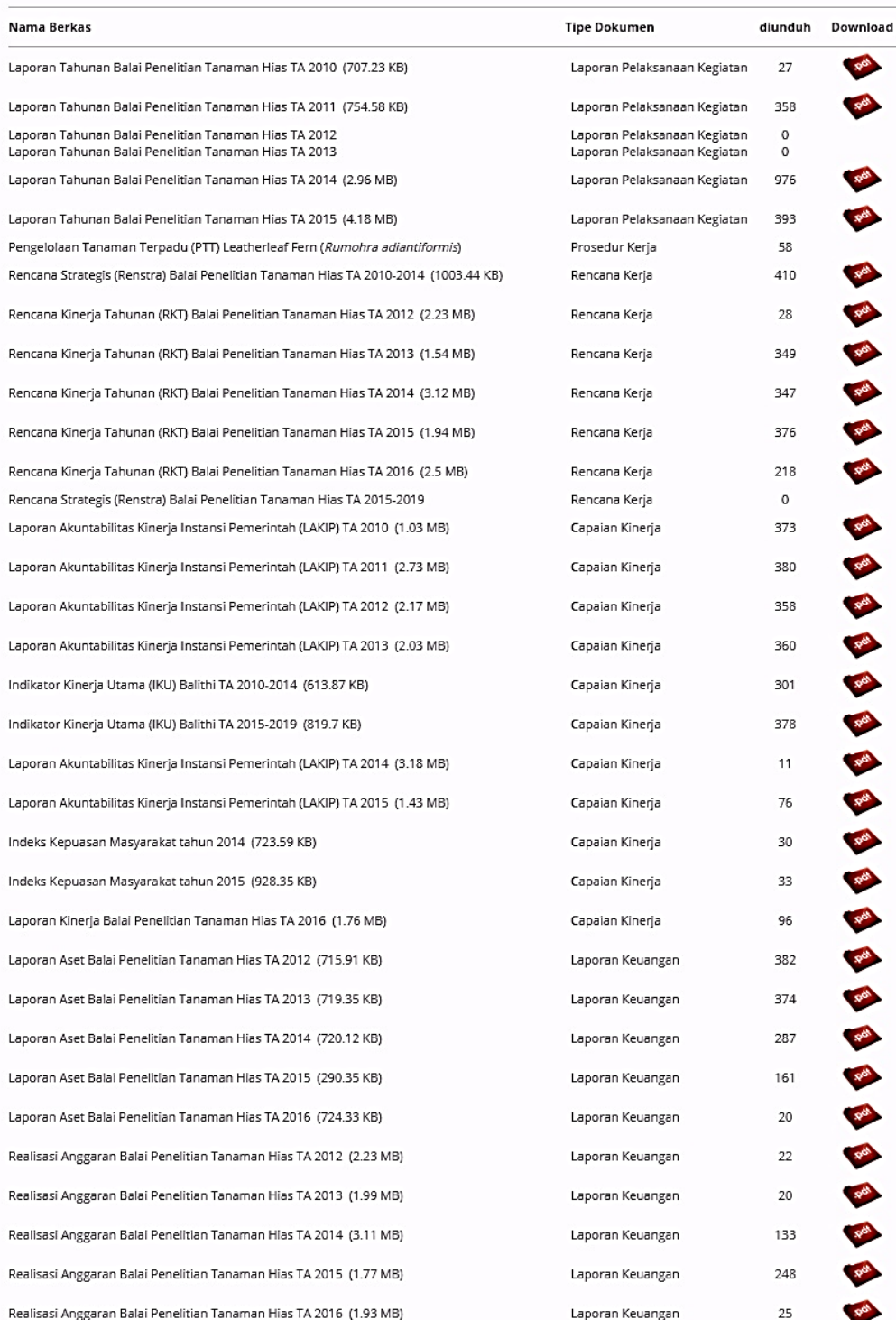
Gambar 3. Daftar Informasi Publik Disediakan dan Diumumkan Secara Berkala